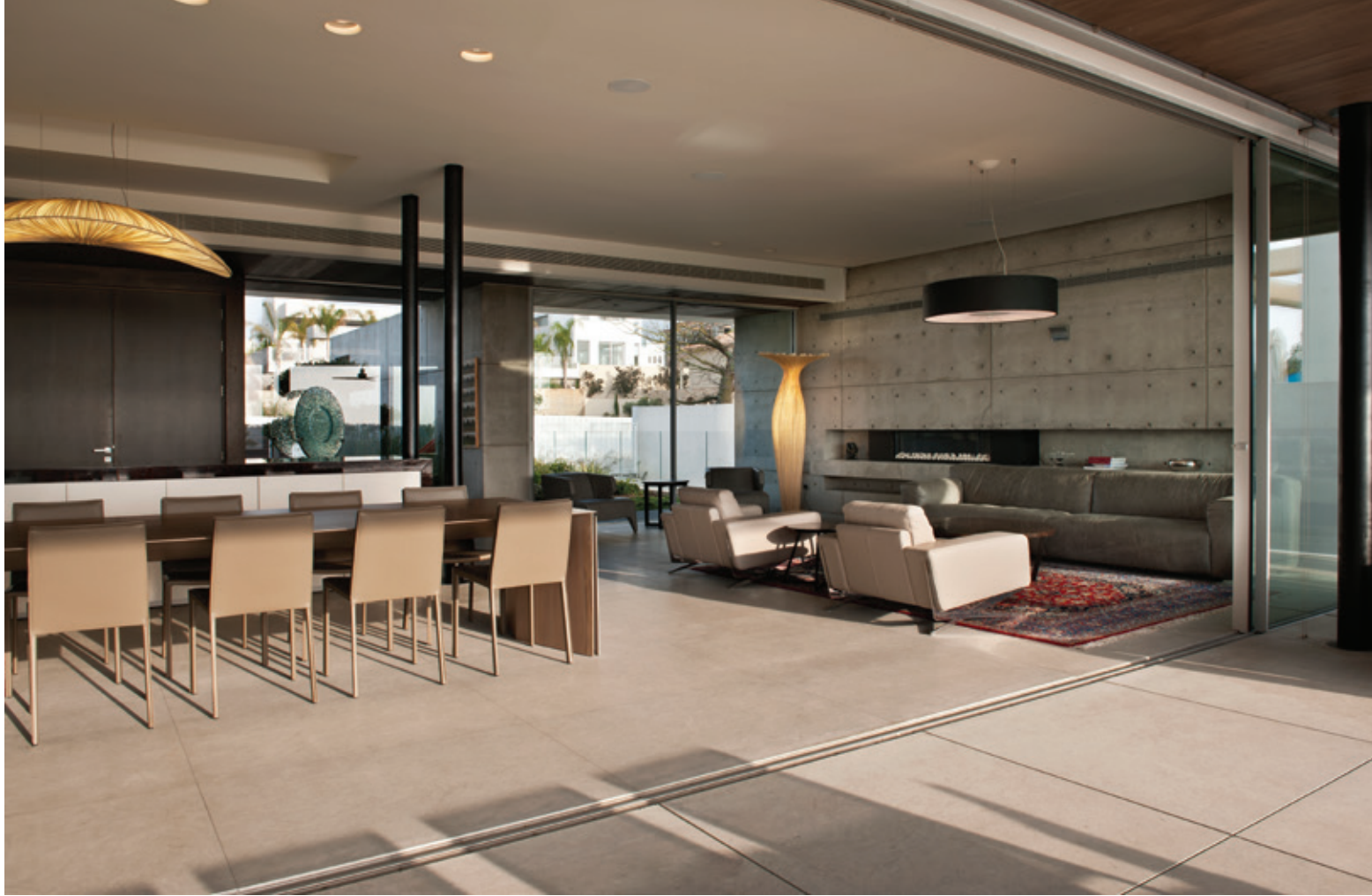
ריהוט: "סיאם", פינת אוכל: "NISO רהיטים".

הסלון אשר עוצב סביב קמין ארוך הטמון בתוך קיר בטון, שממשיך את הקיר החיצוני. בזכות השאיפה לפתוח את הבית במקסימום האפשרי לנוף מצאה האדריכלית פתרונות תמיכה וחיזוק בצורת עמודי פלדה דקים שנצבעו בשחור