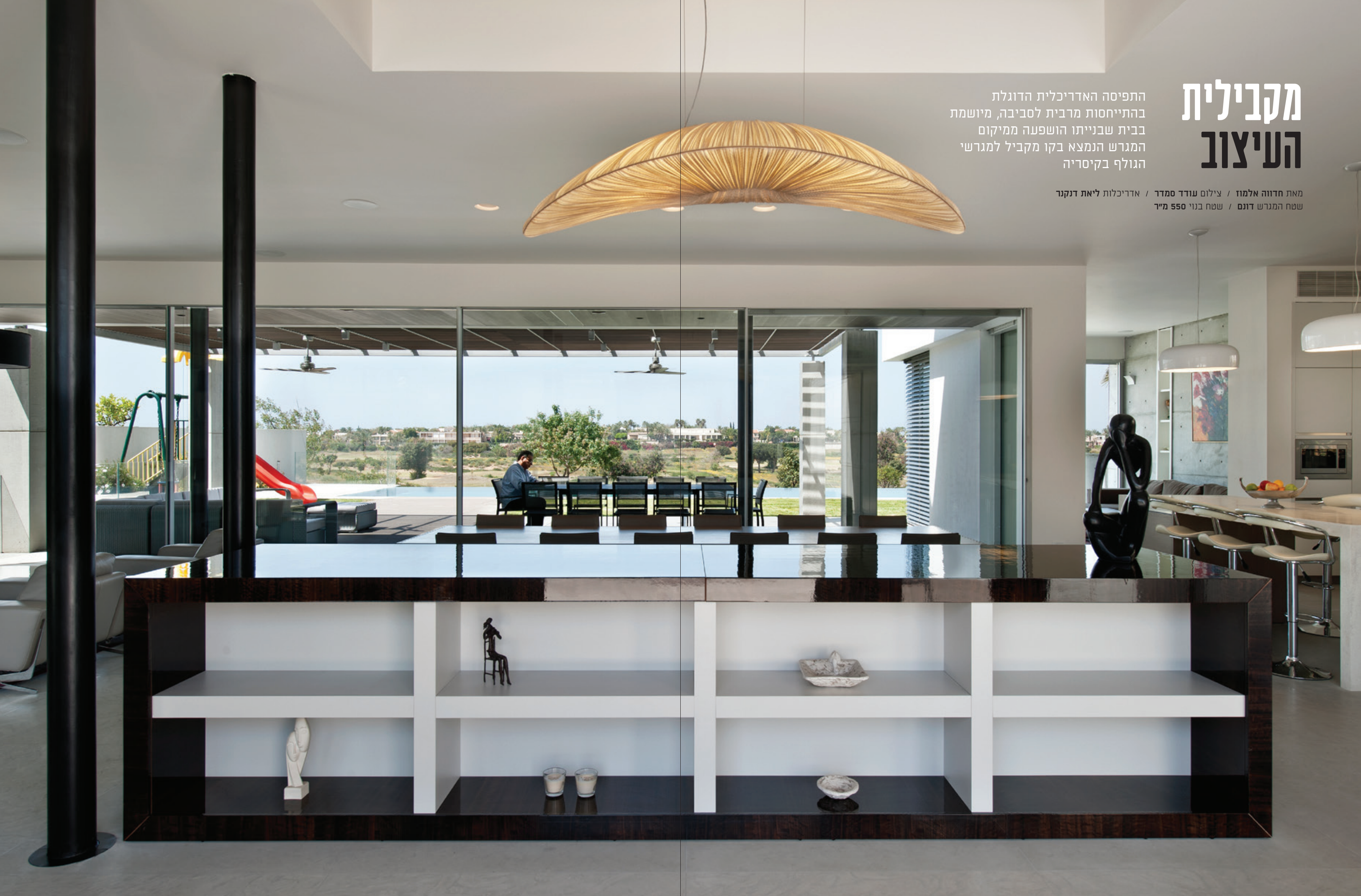
בריכה: "אקוופולקו חן".

מאת חדווה אלמוז / צילום עודד סמדר / אדריכלות ליאת דנקנר שטח המגרש דונם / שטח בנוי 550 מ"ר