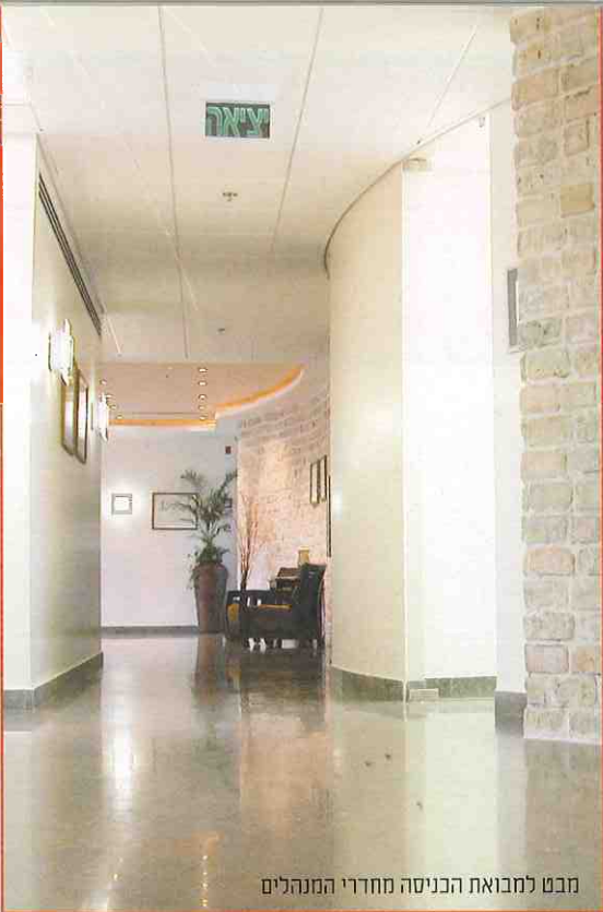
מבט למבואת הכניסה מחדרי המנהלים