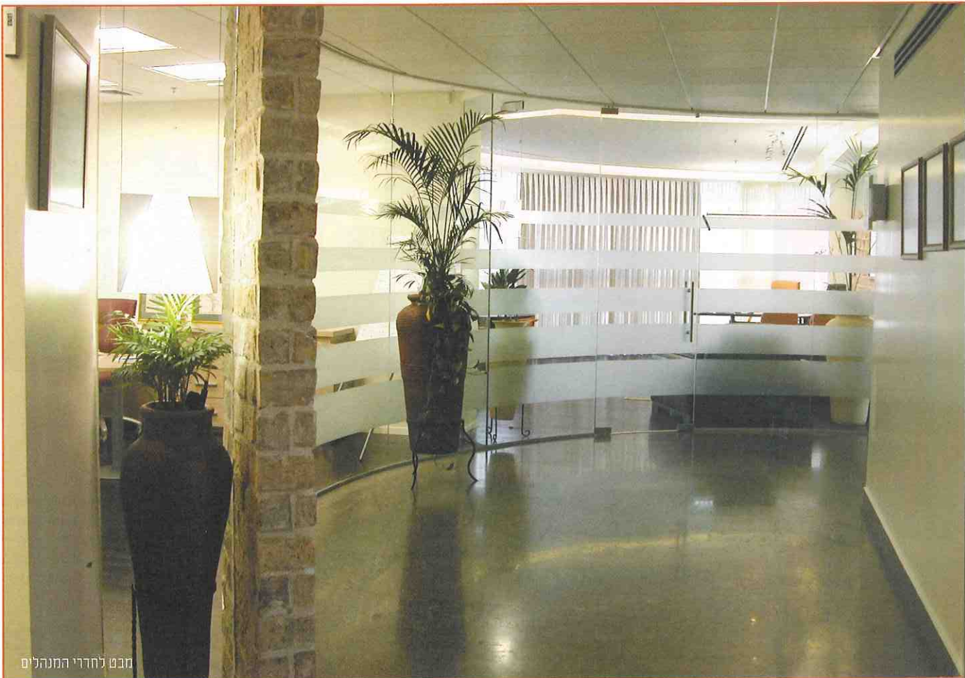
מבט לחדרי המנהלים

ריצוף הפנים שנבחר יוצר שילוב של אבן ביר-זית ופרקט אלון בגוון וונגה, בעוד שהמרפסת עוטה על עצמה "דק" מעץ איפאה. בקירות המפרידים נוצרו משחקים בין זכוכית שקופה וחלבית. בנוסף, בקירות האטומים שילבו המתכננים גוונים שונים, סוגי צבע שונים וקירות המורכבים מלבנים שרופות עתיקות שיובאו מבלגיה. התוצאה הסופית יצרה את השילוב המורכב אותו ביקשו מנהלי החברה - מינימליזם מודרני ונקי מול חמימות ביתית. ■